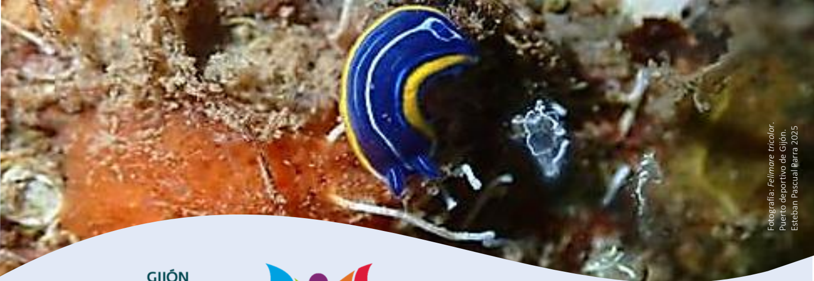
Fotografía: Felimare tricolor . Puerto deportivo de Gijón. Esteban Pascual Parra 2025